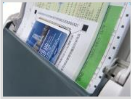
크기가 다른 문서와 신분증 동시 스캔